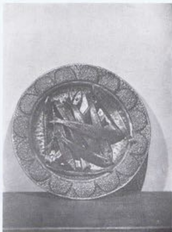
RUFINO PEÓN.—«Sardinas frescas».