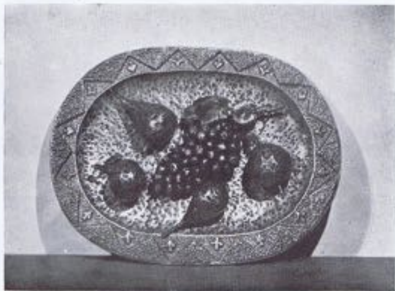
RUFINO PEÓN. — «Frutas».