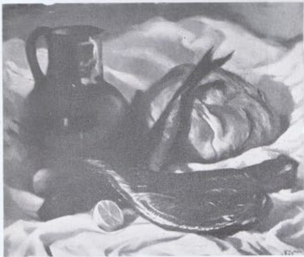
JAVIER LÓPEZ-VAZQUEZ (México).—«Bodegón».