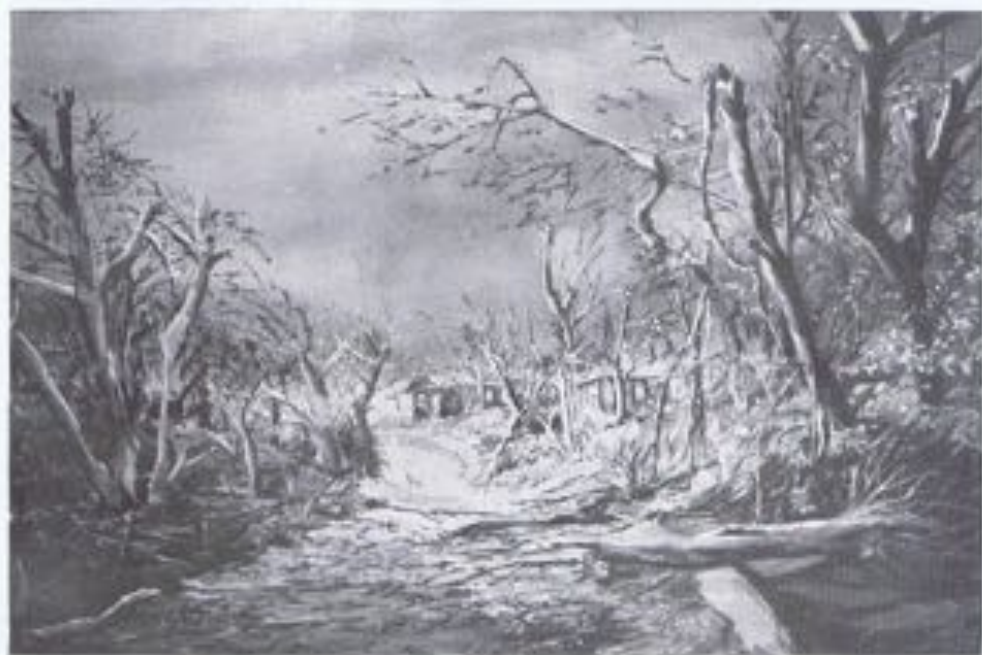
GUILLERMO SUREDA.—«Tempestad tropical».—Puerto Rico.