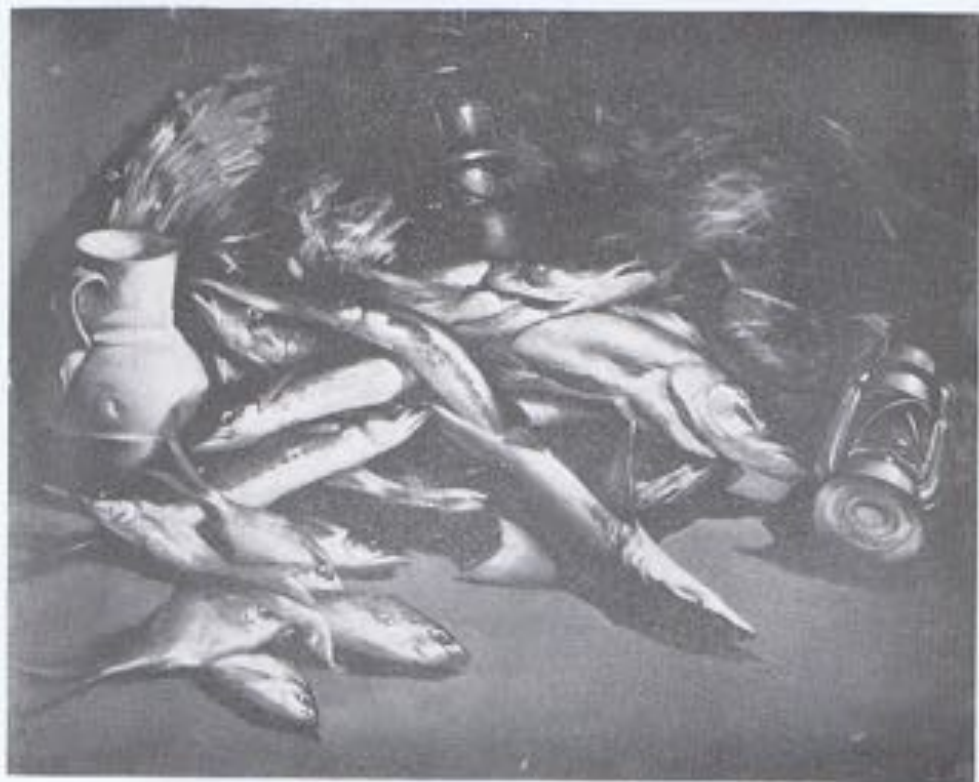
DEMETRIO LLORDEN (México). — «Bodegón».