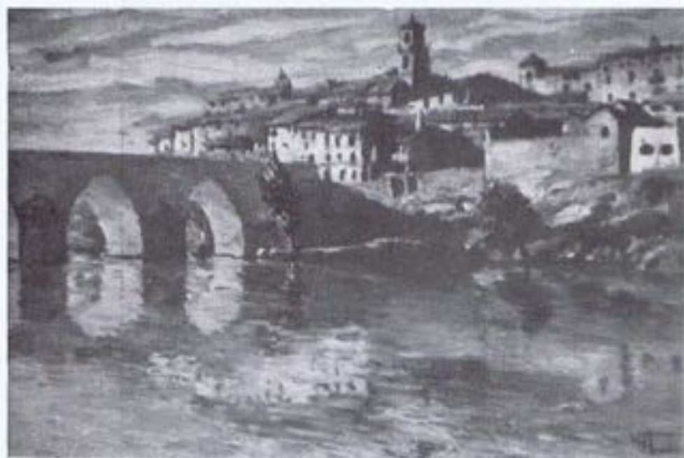
MERCEDES DEL VAL TROUILLHET.—«Tordesillas».