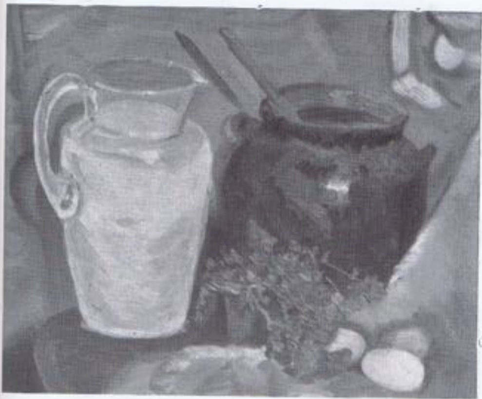
JULIÁN C. CASCO.—«Bodegón».