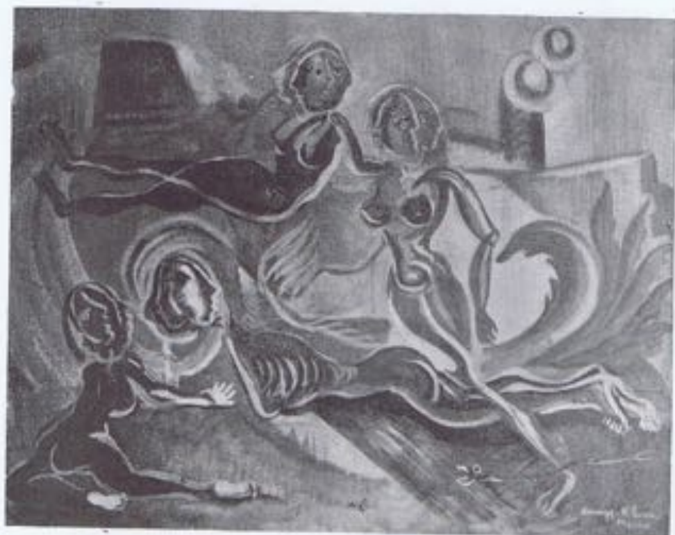
CAMPS RIBERA,—«El campo de Veracruz».