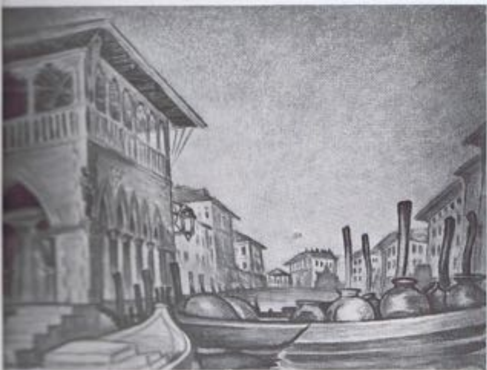
GODOFREDO BUENOSAIRE. — «Pescadería-Gran Canal» (Venecia).