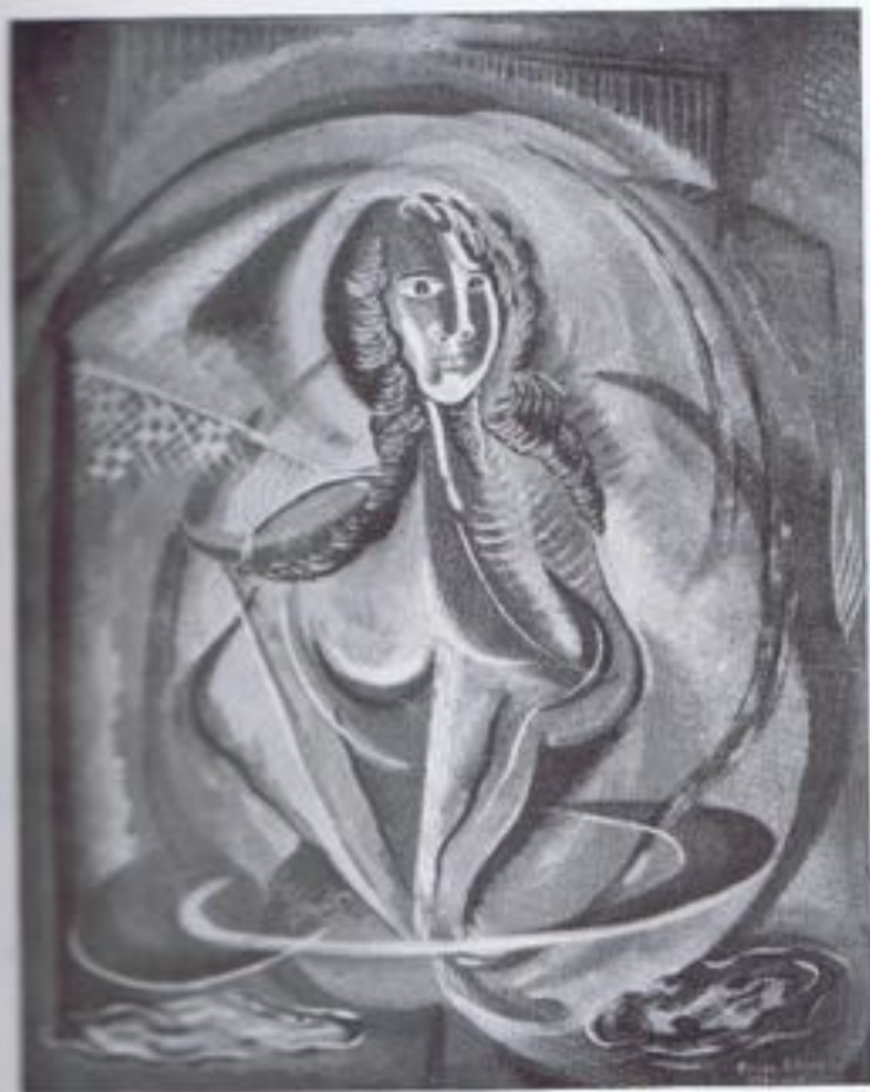
CAMPS RIBERA.—«México tropical».