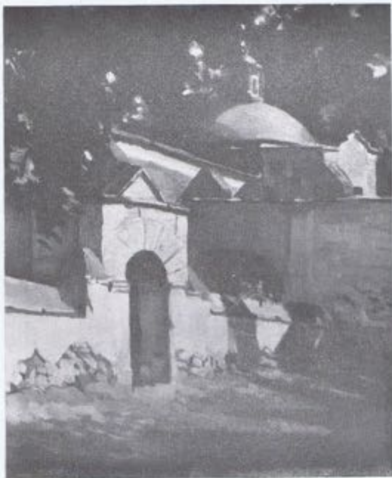
JAVIER LÓPEZ-VÁZQUEZ (México).—«Paisaje».