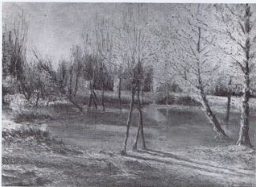
MANUEL G. PANADERO.—(Paisaje).