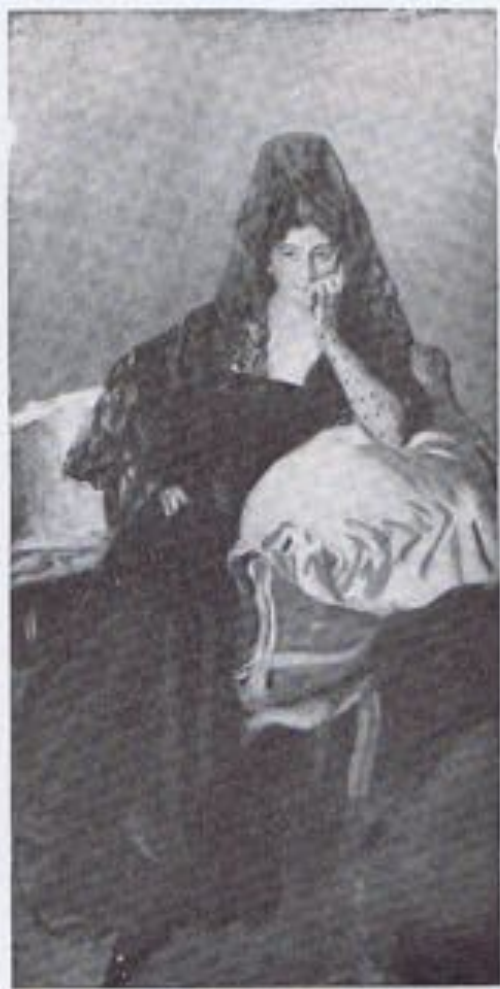
JOAQUIN SOROLLA.—«Retrato de la señora viuda de Urcola».