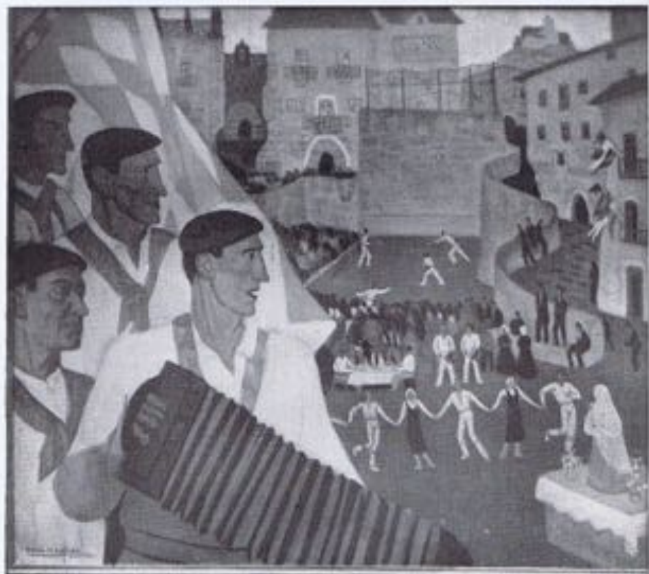
RAMON DE ZUBIAURRE.—«Tipos vascos».