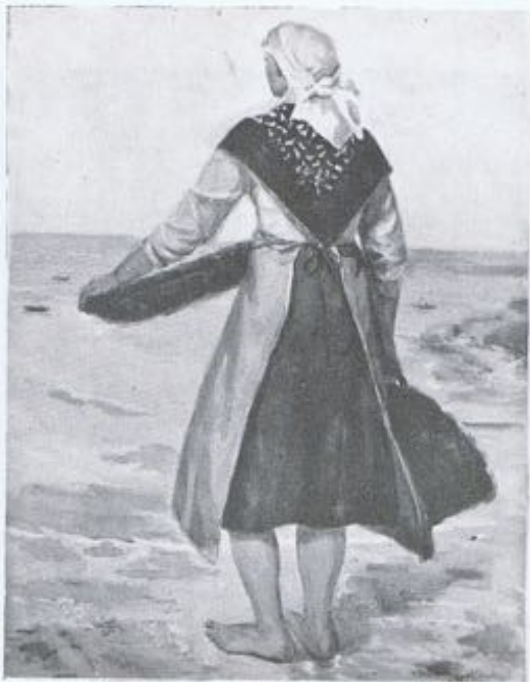
PAULA MILLAN ALOSETE.—«Pescadora» (acuarela).