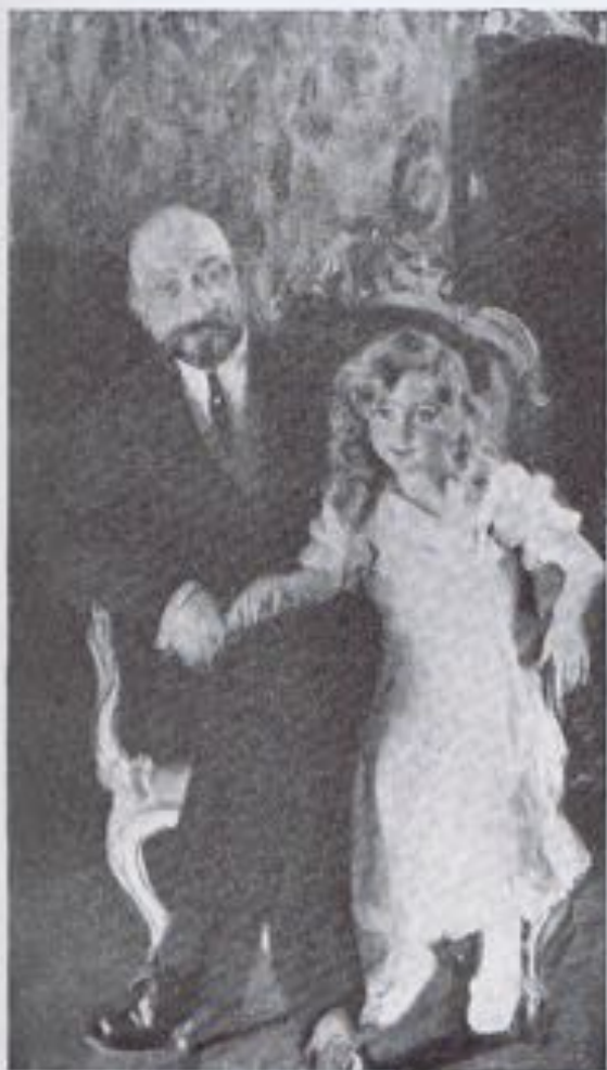
JOAQUIN SOROLLA.—«Retrato de don Carlos Urcola».