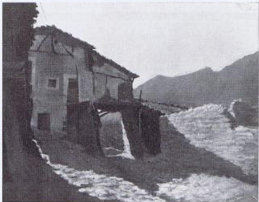
MANUEL CANO.—«El balcón».