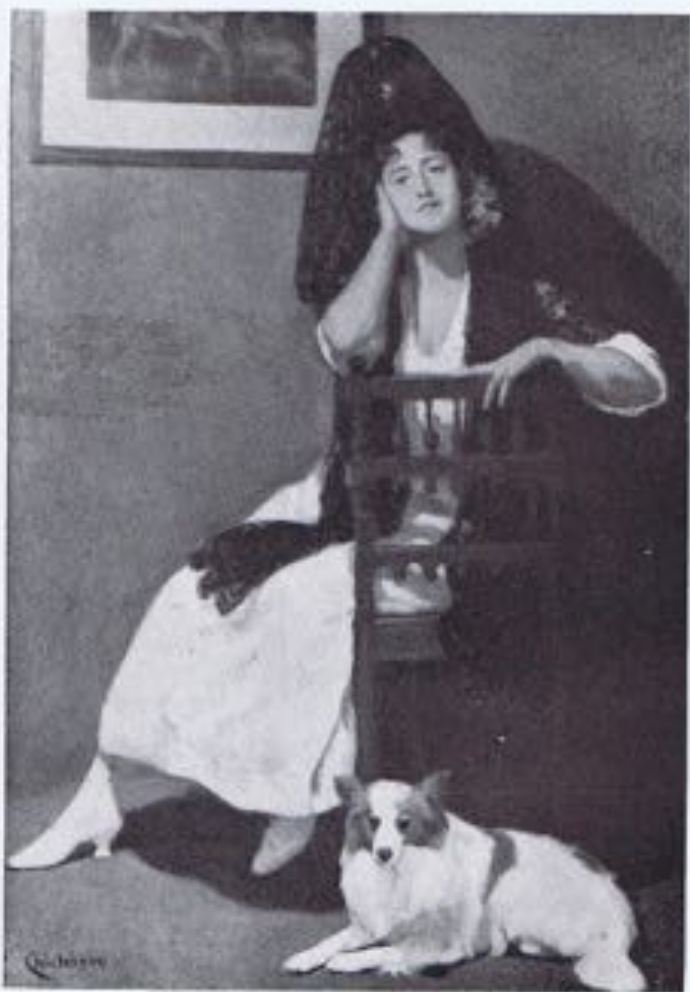
EDUARDO CHICHARRO (padre). — «La esposa del pintor».