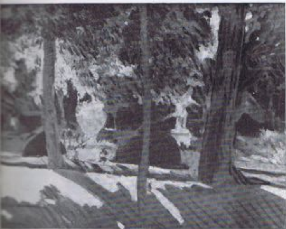
JOAQUIN SOROLLA.—«Jardines de la Granja».