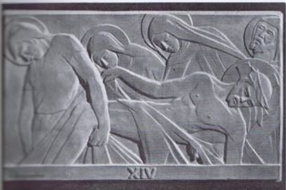
G. BUENOSAIRE. — «Entierro de Cristo» (cerámica).