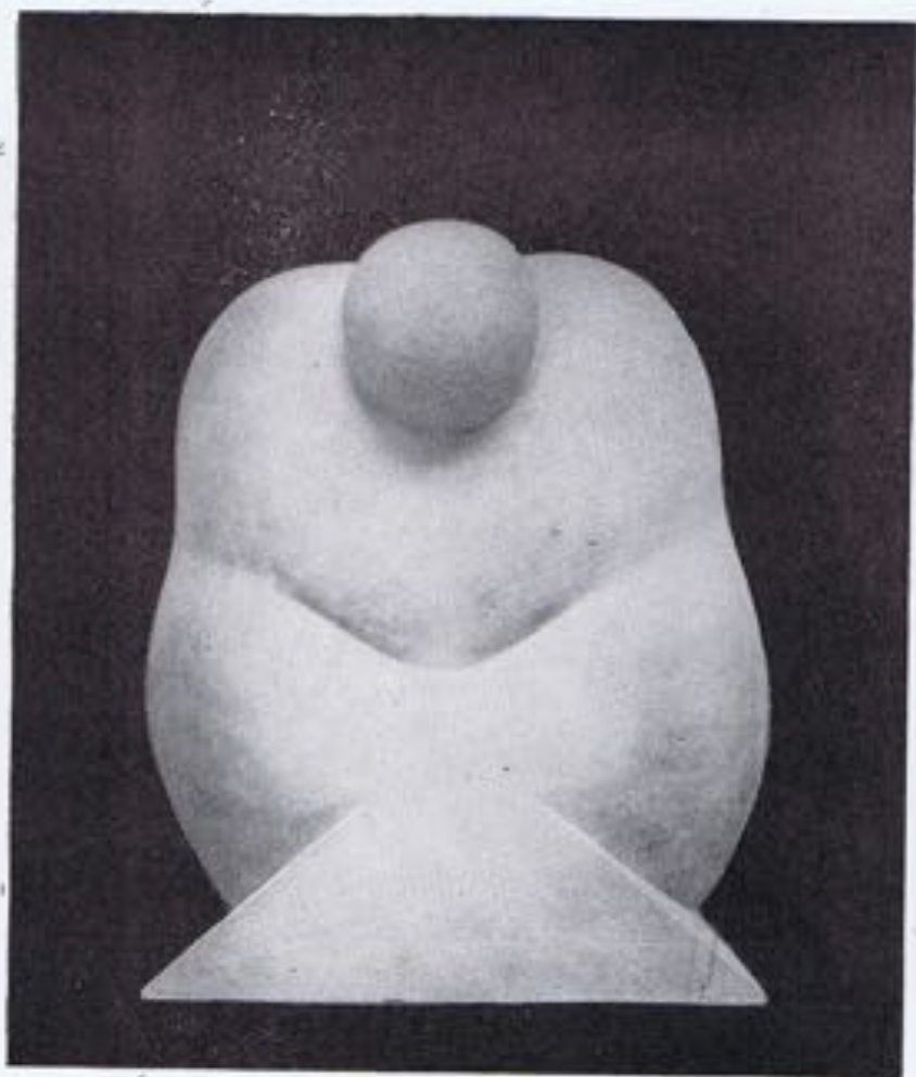
SANTIAGO DE SANTIAGO.—•Figura•.