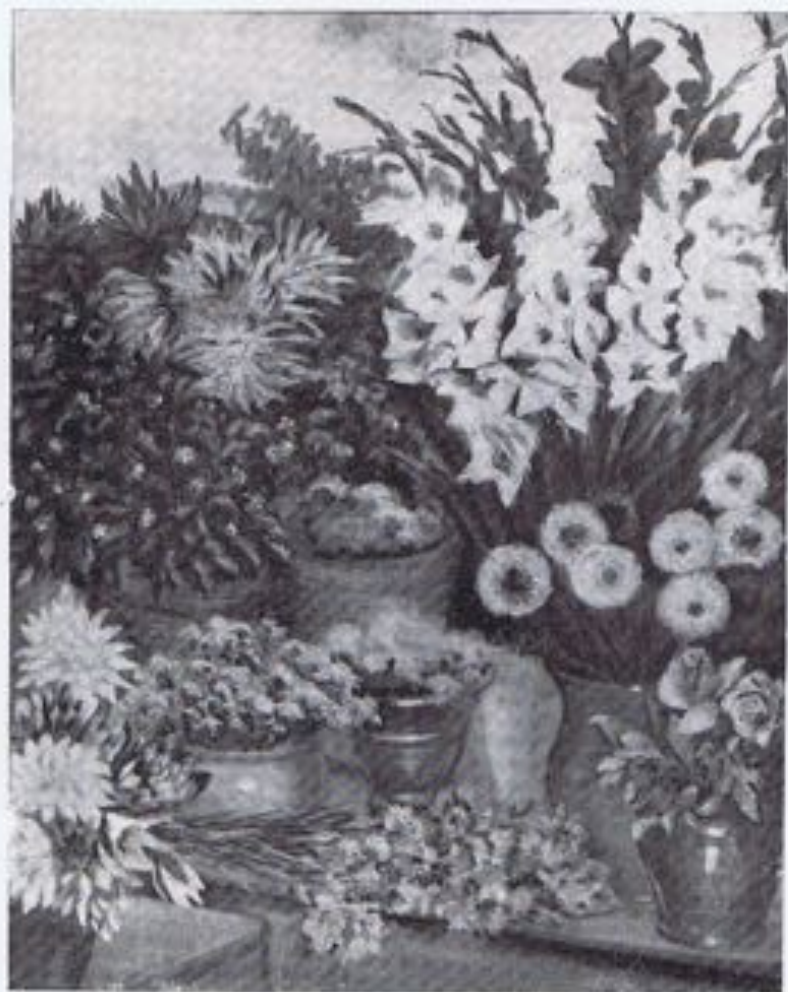
JULIO PASCUAL SOLÉ.—«Flores».