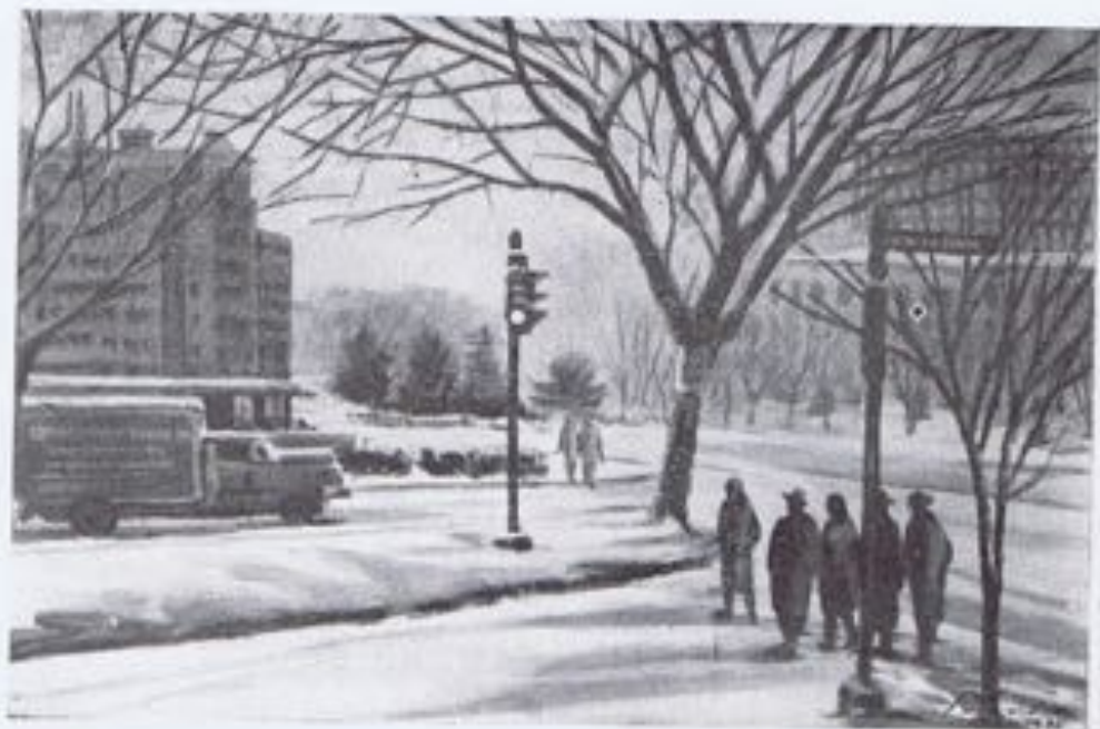
GUILLERMO SUREDA.—«Luz verde».