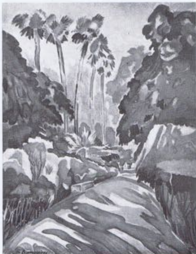
G. BUENOSAIRES.—«Un rincón del parque» (Castellón).