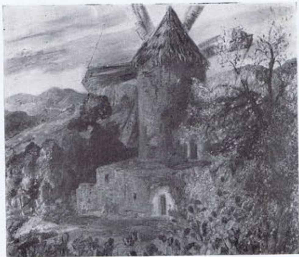
EMILIO POU G. MORO.—«Molino en Mallorca.»