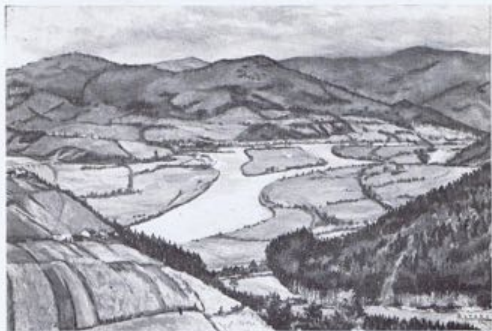
JOSE SOTO.—«Valle del Nalón».