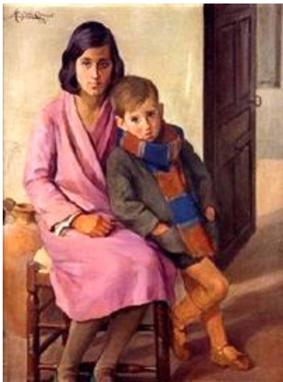
Madrecita, obra del XII Salón de Otoño