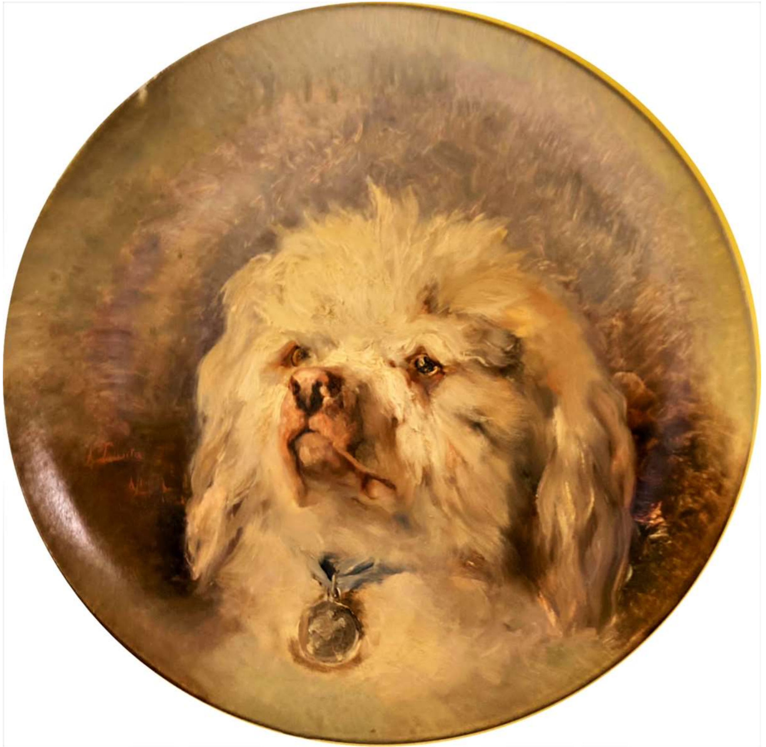
Imagen de una obra de Lily Lhardy.