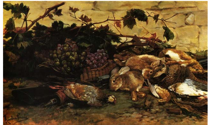
Bodegón de caza

Acudió también a las Bienales del Círculo de Bellas Artes y a la Exposición Internacional de 1892, donde obtuvo una mención.