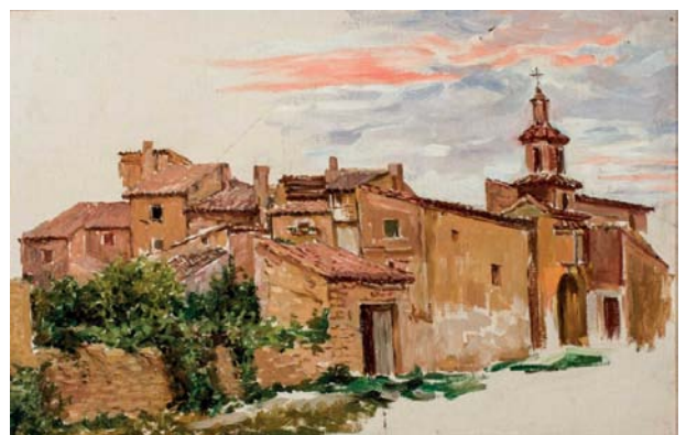
Plaza de Quinto de Ebro

Los últimos años de su vida los pasó en Zaragoza donde compaginó su afición a la pintura con su profesión de maestra. Murió en Quinto de Ebro (Zaragoza) en 1917.