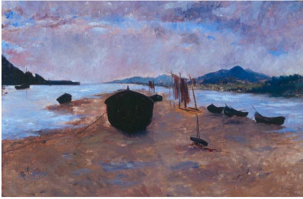
Puerto de San Estéban