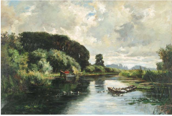
Cercanías de Vriesland