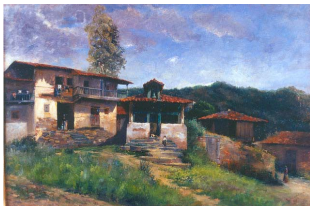
La capilla de la aldea

En 1882 marchó a Madrid, donde en dos años más tarde formó parte del grupo de las primeras seis mujeres que se matricularon en la Escuela Especial de Pintura, Escultura y Grabado, con un permiso especial del Rey.