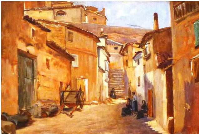
Subida al piquete desde la calle Mayor