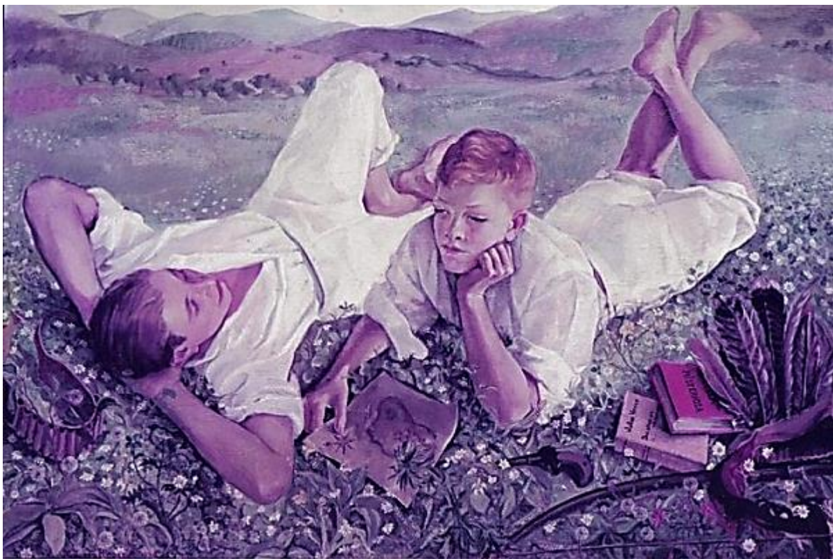
La isla del tesoro