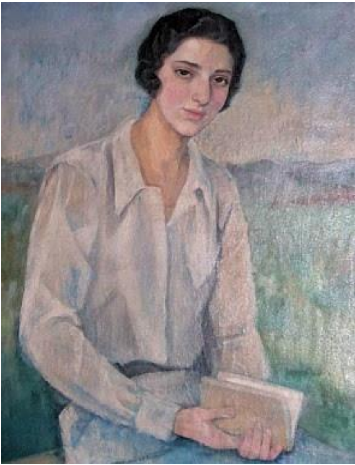
Mujer de azul. 1928

Segunda Medalla en la Nacional de 1941 por el lienzo titulado La Anunciación.