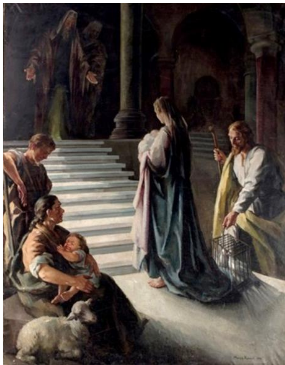
Presentación de Jesús en el Templo

Ambas descansan en la misma tumba en la Sacramental de San Isidro de Madrid.