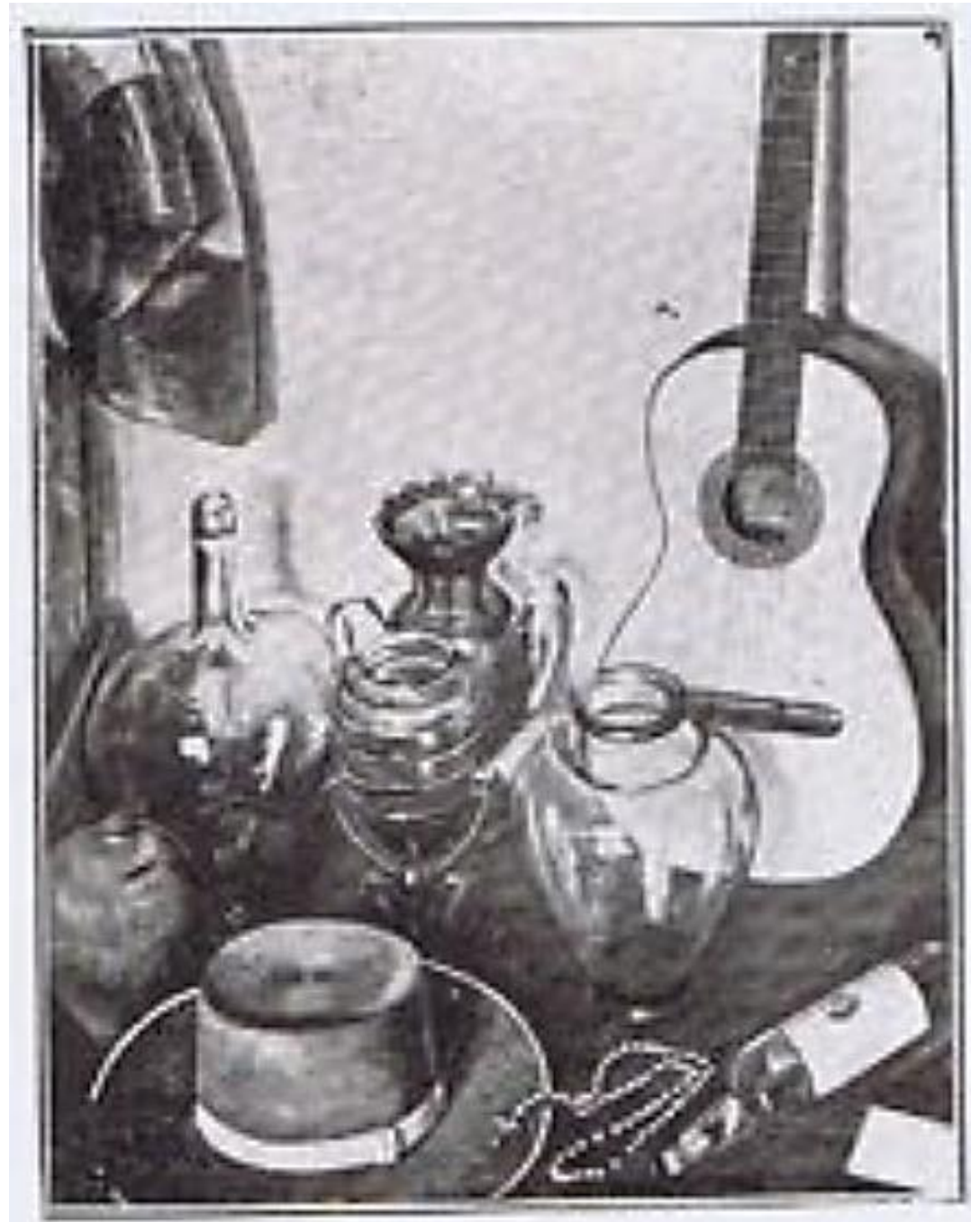
Cristal y calidades. XI Salón de Otoño de 1931