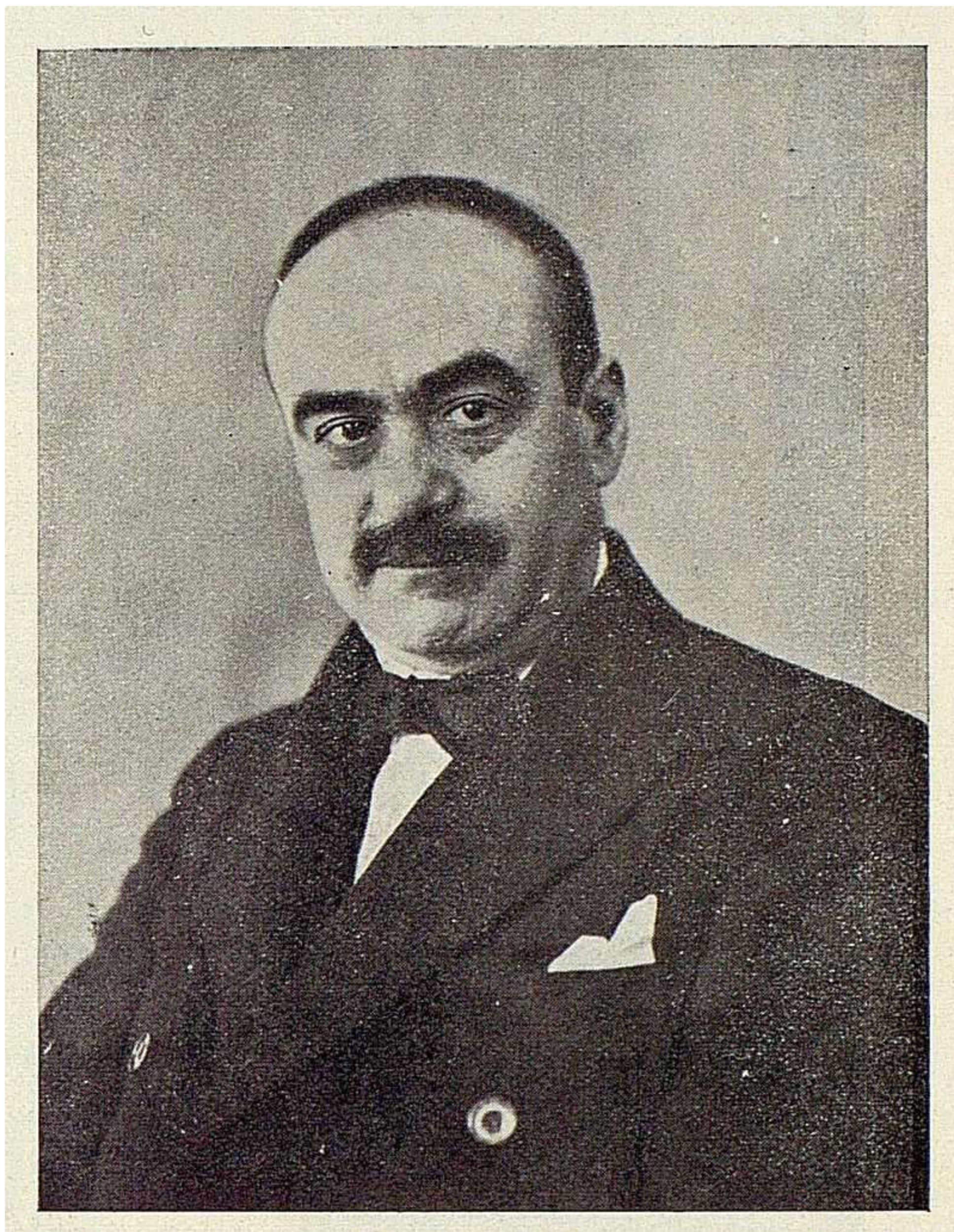
Ángel Vegué en 1926