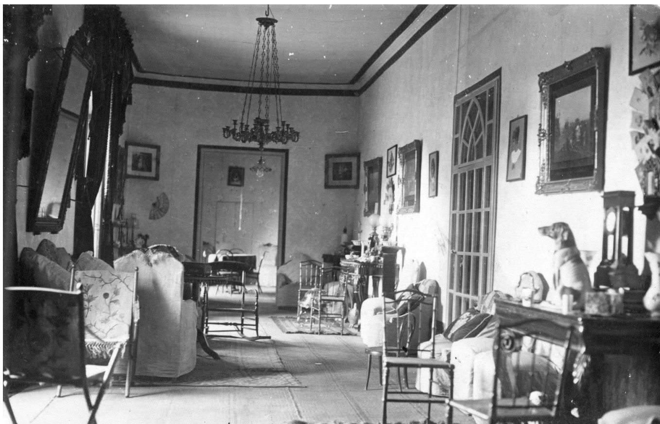
Interior del Palacio de Gracia Real