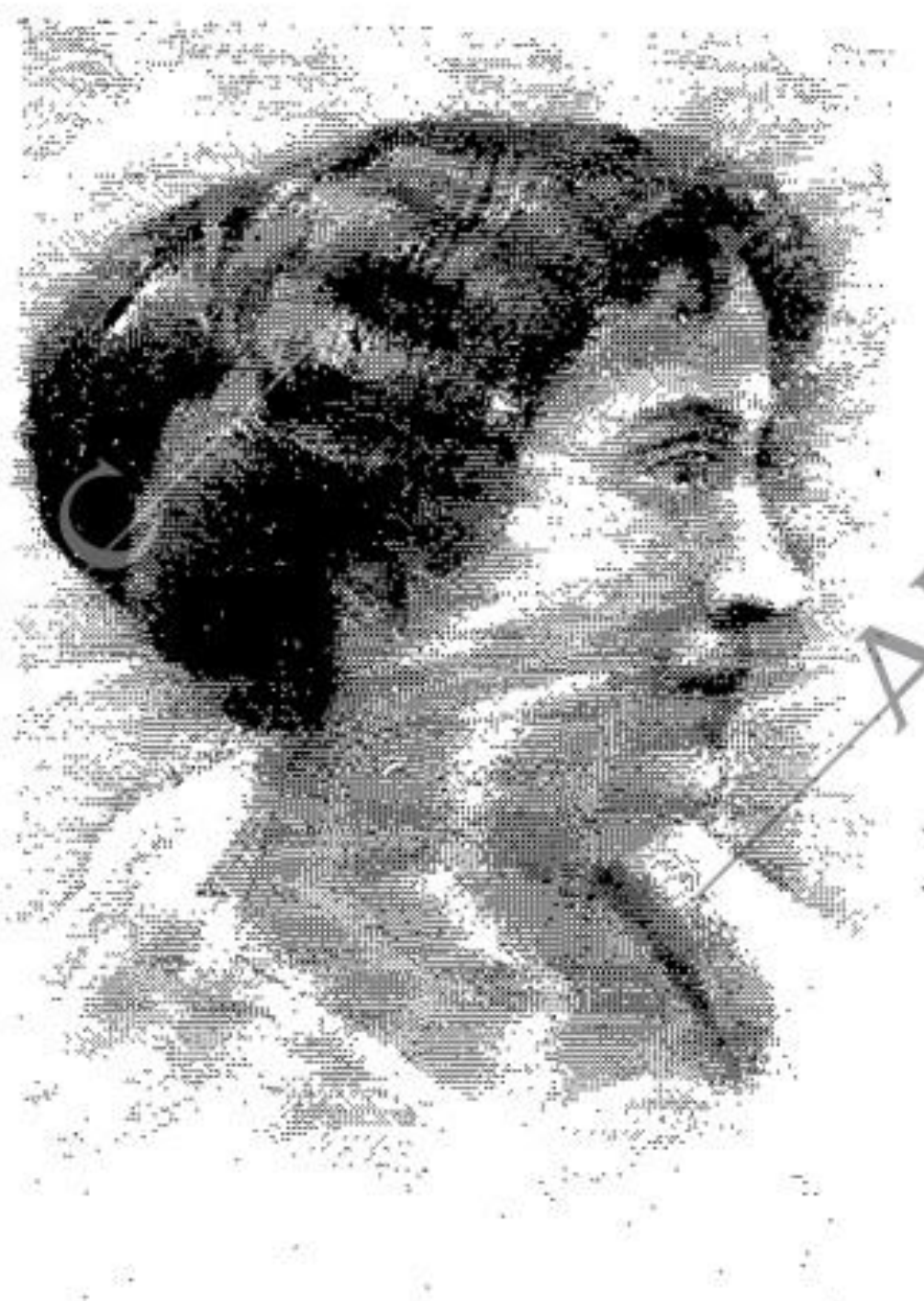
Blanco y Negro, 1928

668.- La Pastorcita en Sierra Morena, lápiz, 0,63 x 0,47