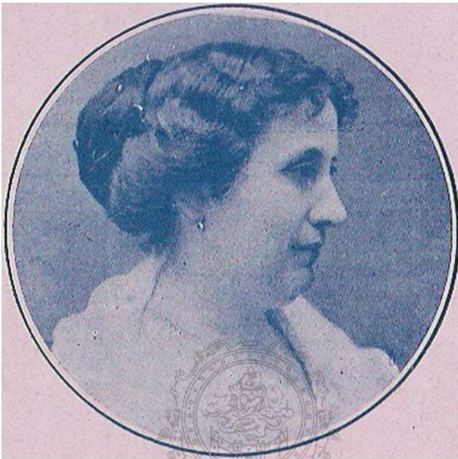
Dos fotografías de la artista