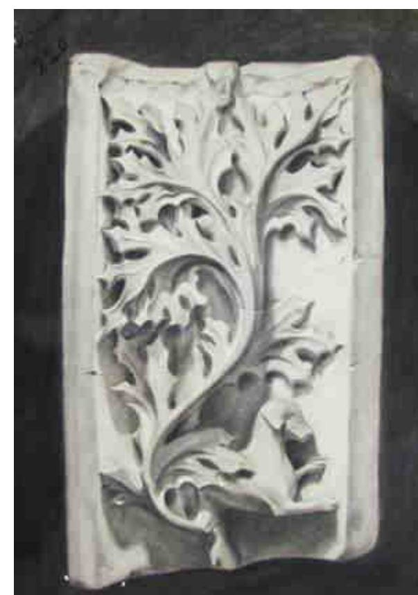
Dibujo a carboncillo

A partir de esa fecha, perdemos su pista, aunque sí podemos confirmar que falleció en Madrid, el 8 de enero de 1987.