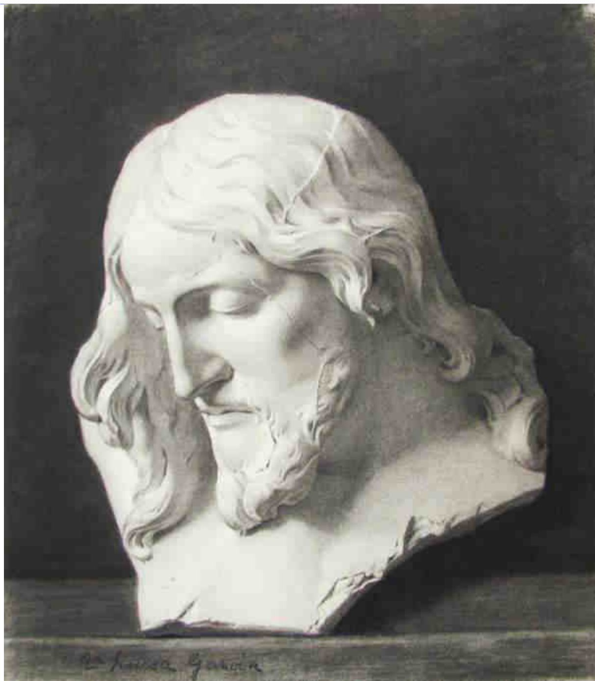
Dibujos a carboncillo y la fotografía aparecida en El Heraldo de Madrid, 1934