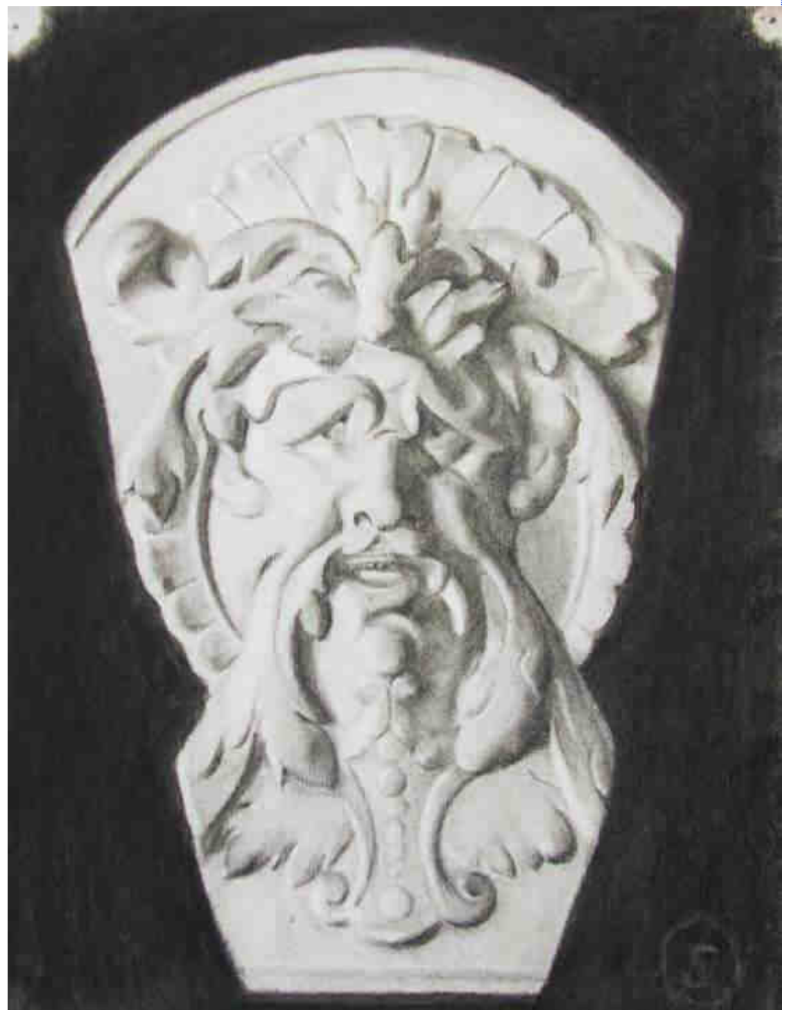
Dibujo a carboncillo