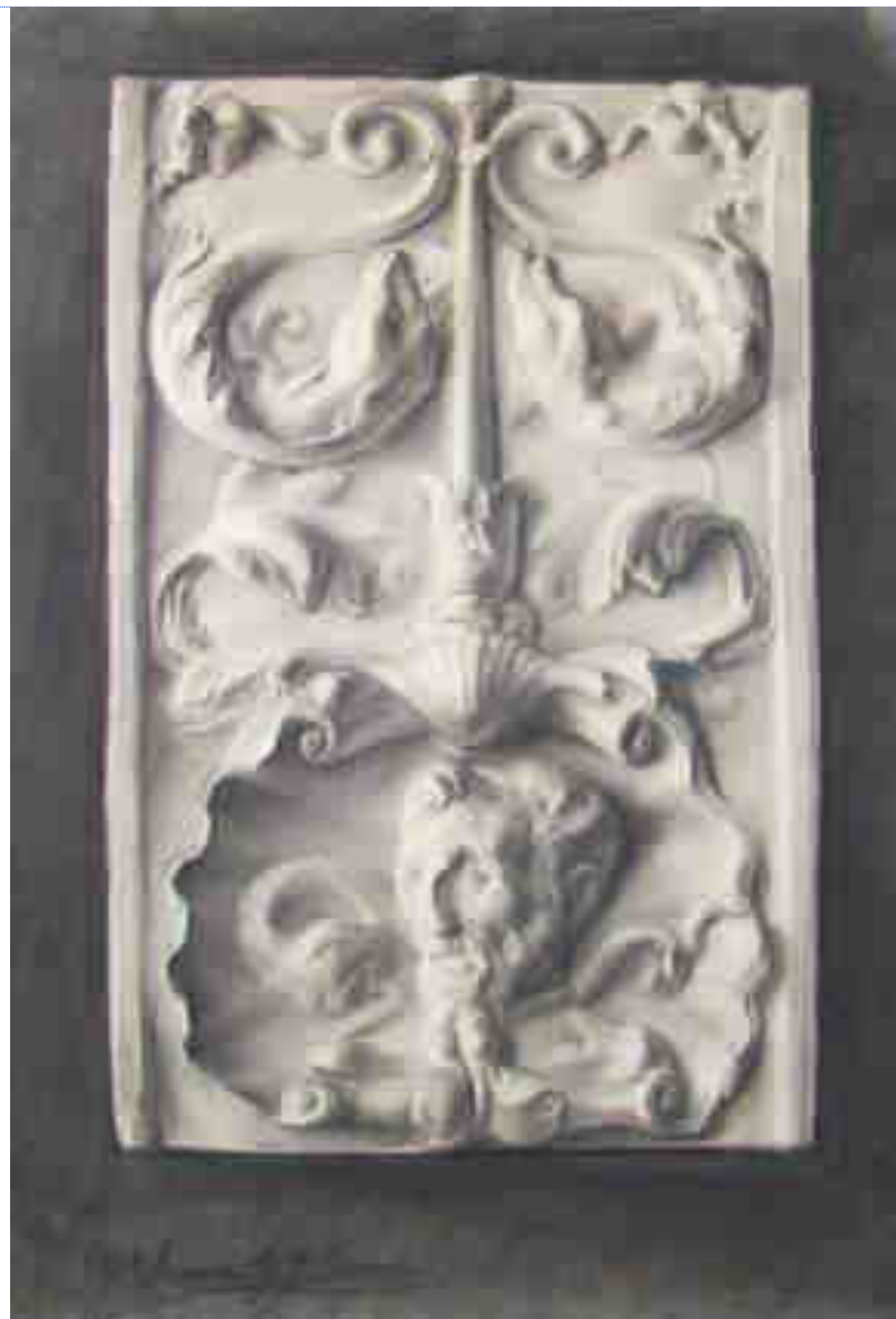
Dibujos a carboncillo