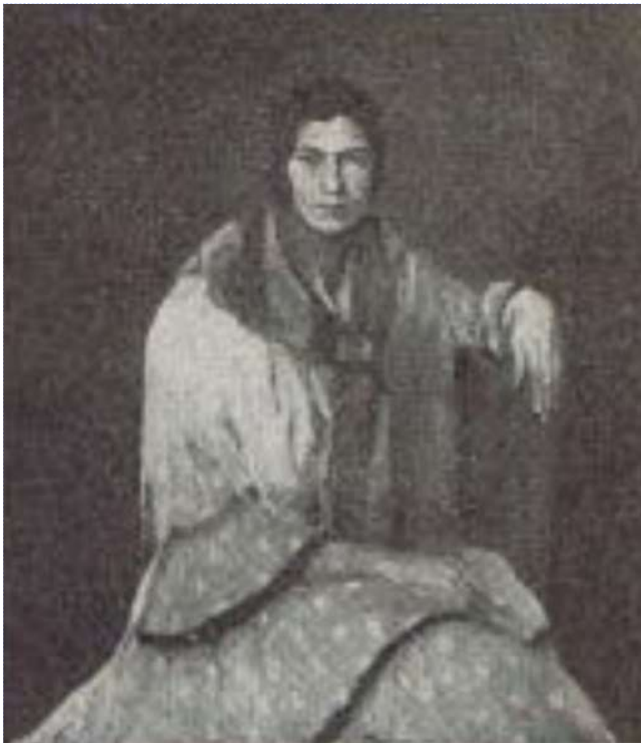
Gitana, obra presentada al IX Salón de Otoño