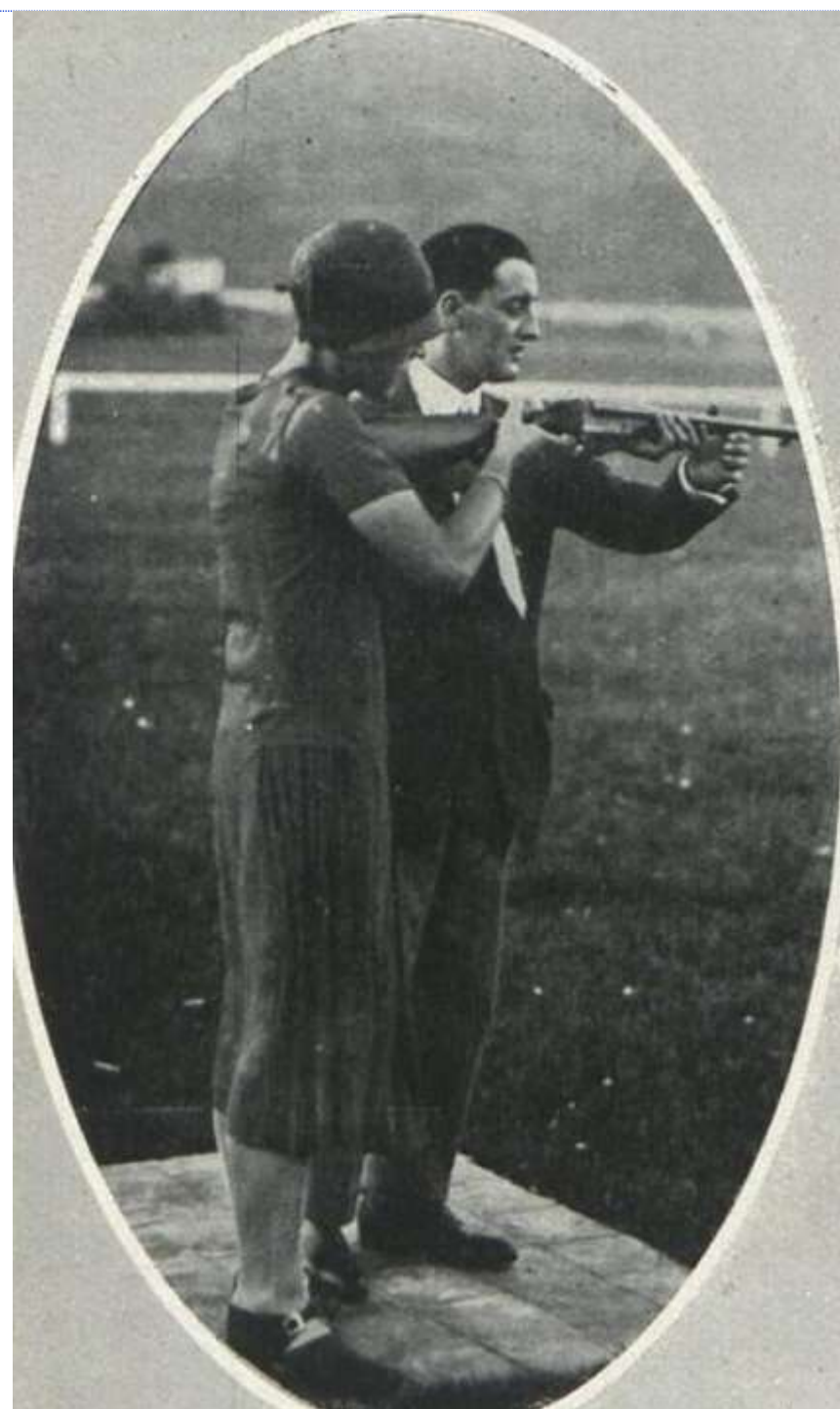
La hormiga de oro, 1925 La artista en Estampa, 1928 José Linares Rivas La Nación, 1931