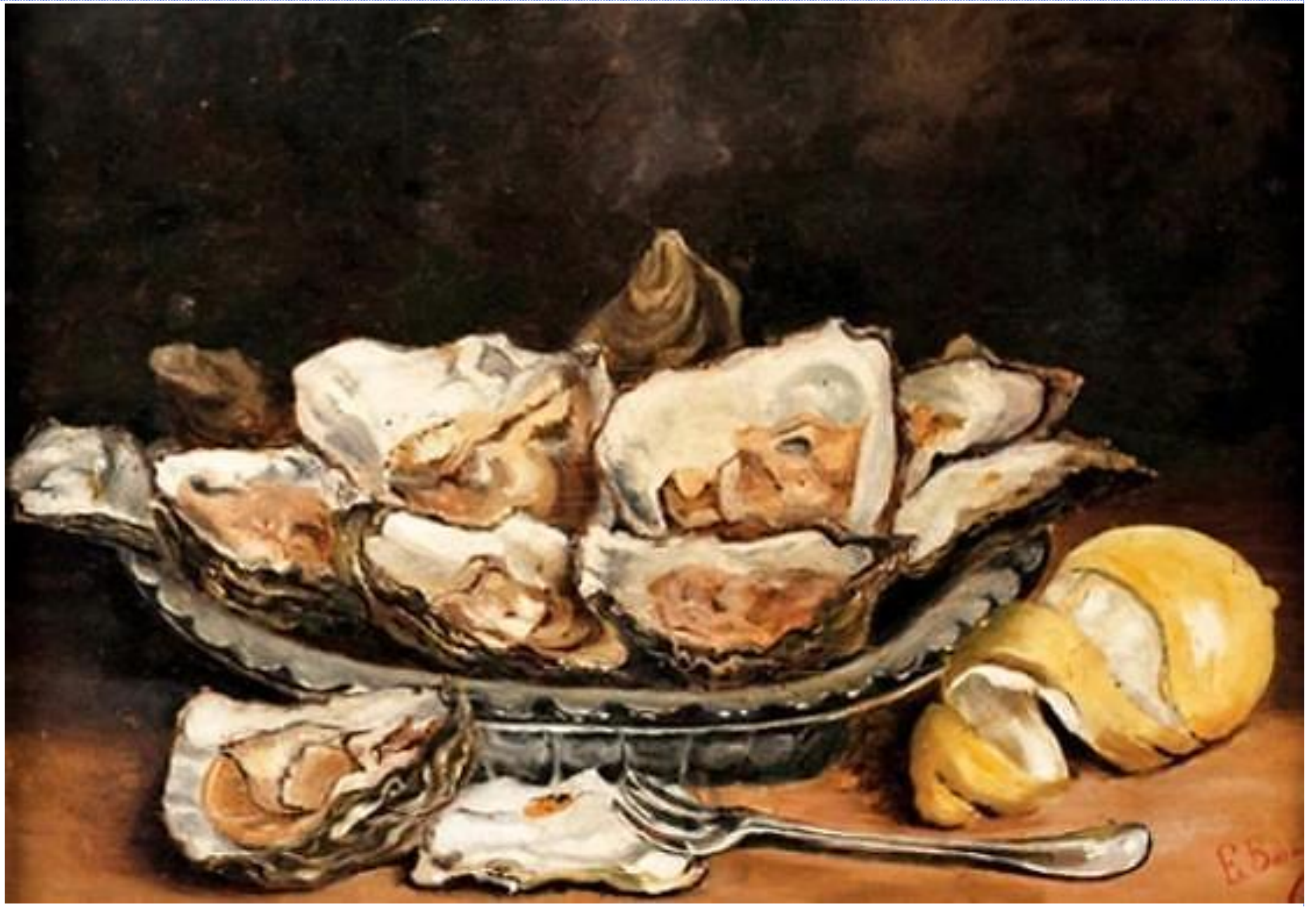
Bodegón de ostras y Bodegón de caza