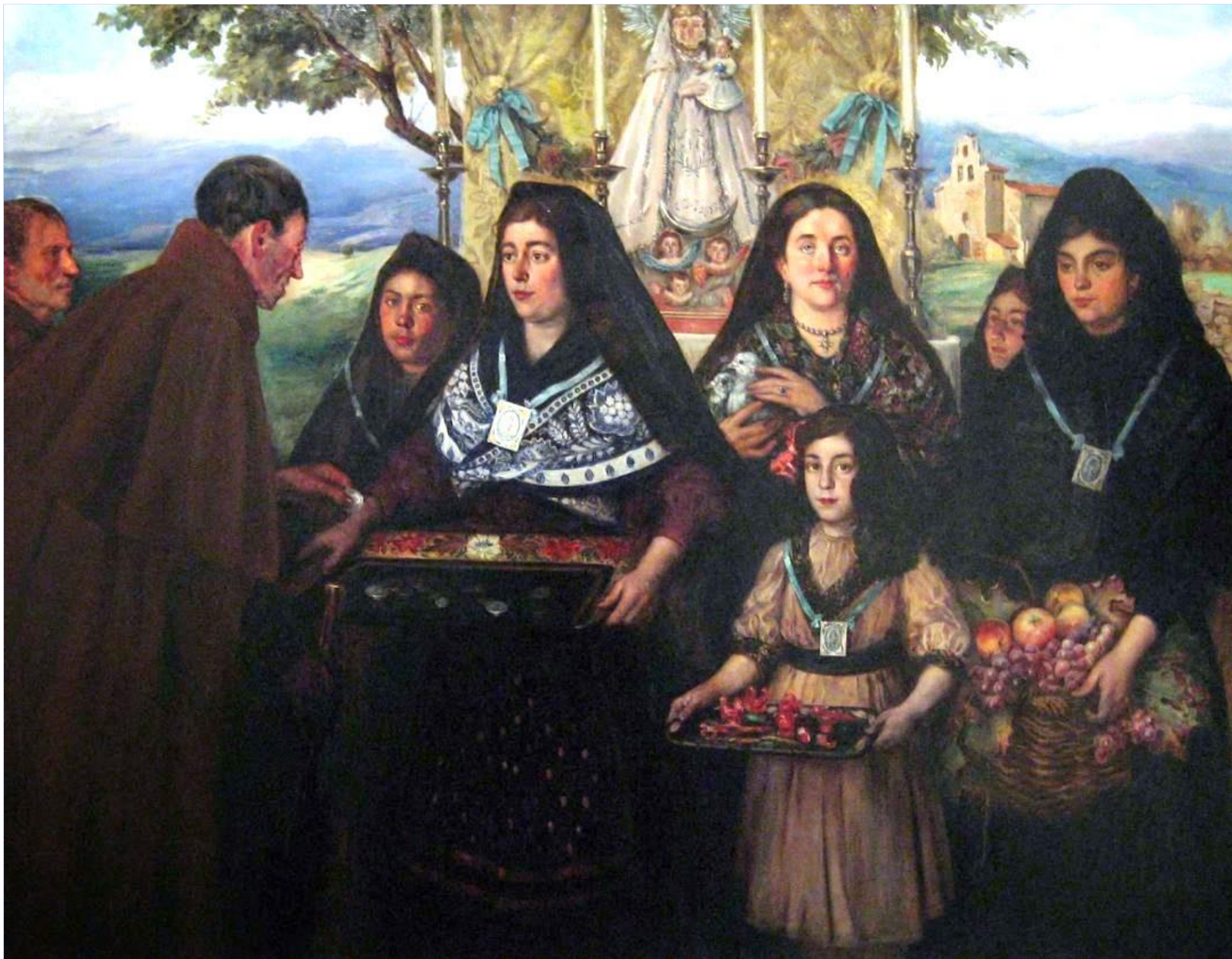
Las camareras de la Virgen