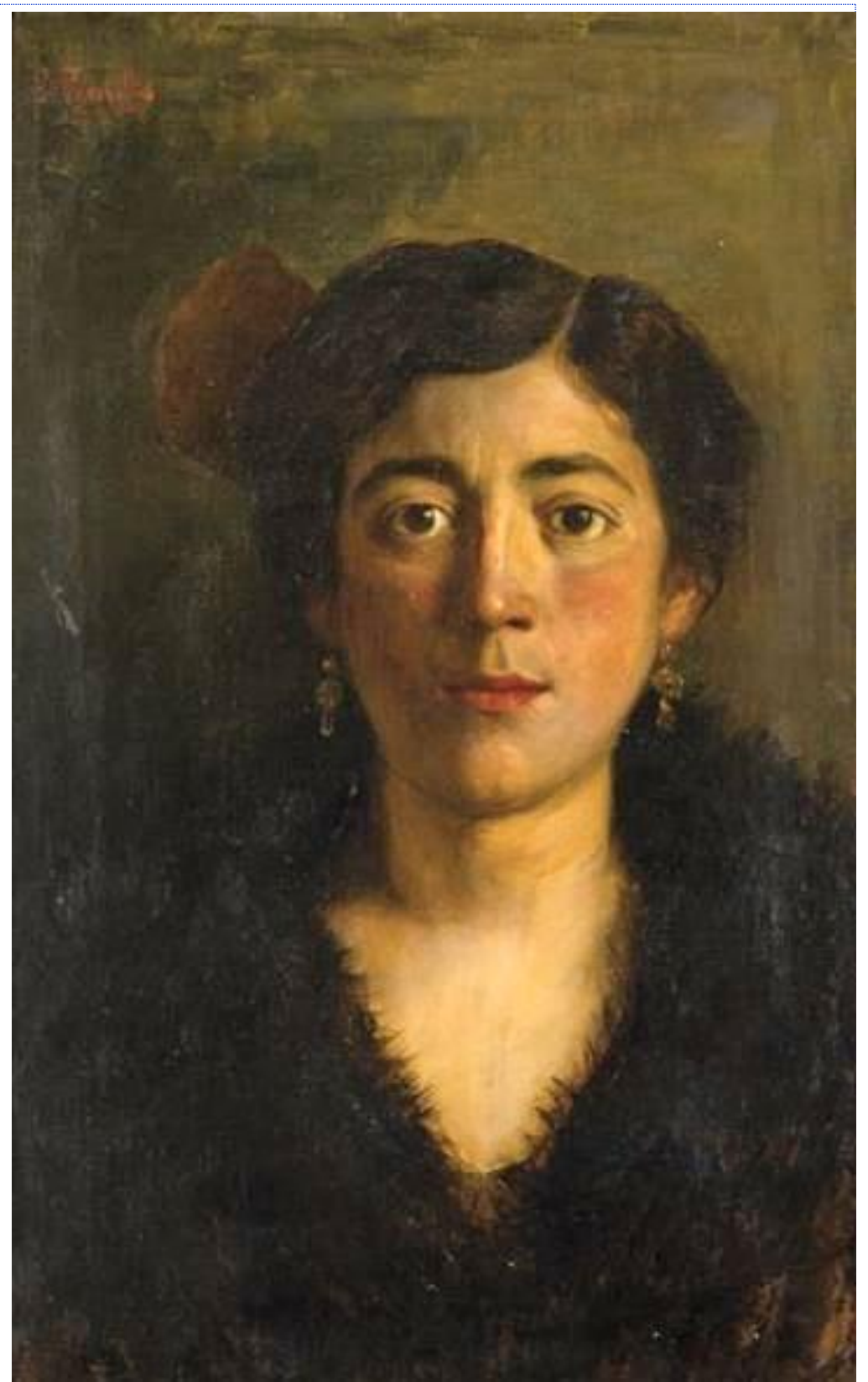
Retrato de dama