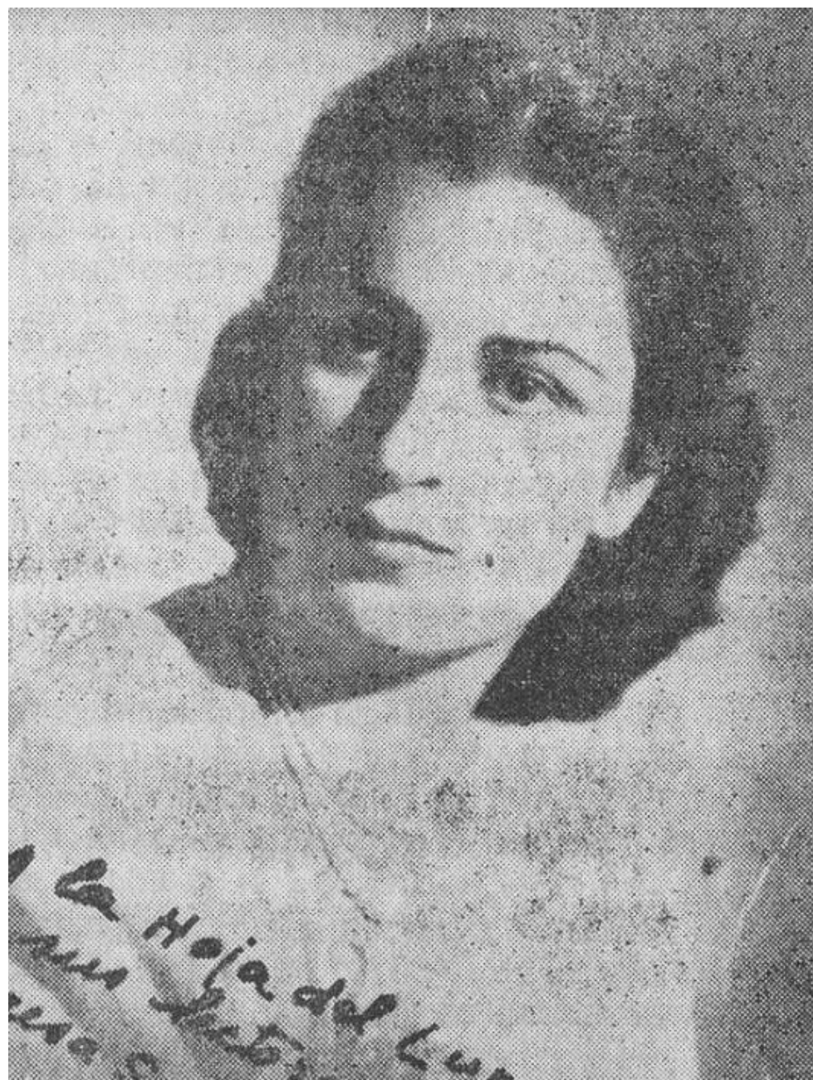
La artista en una fotografía aparecida en la Hoja del Lunes, 1967