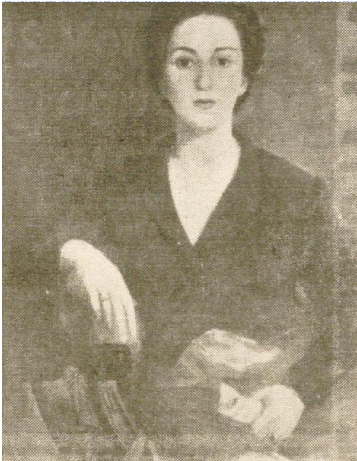
Autorretrato, obra presentada al XXVIII Salón de Otoño