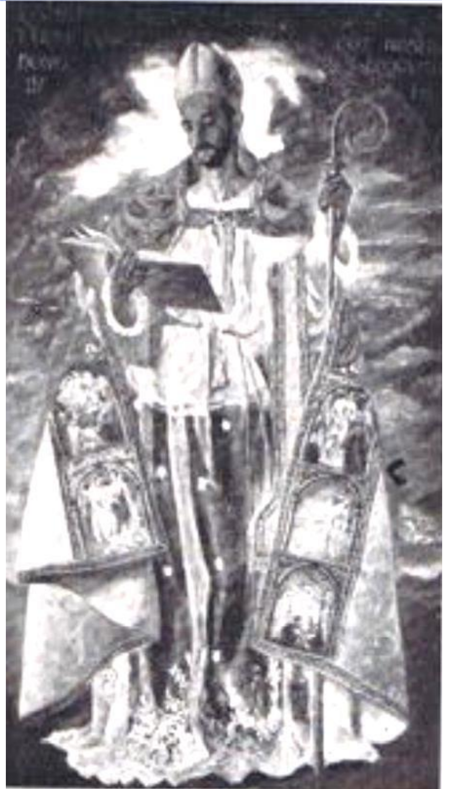
San Agustín del XVI Salón de Otoño