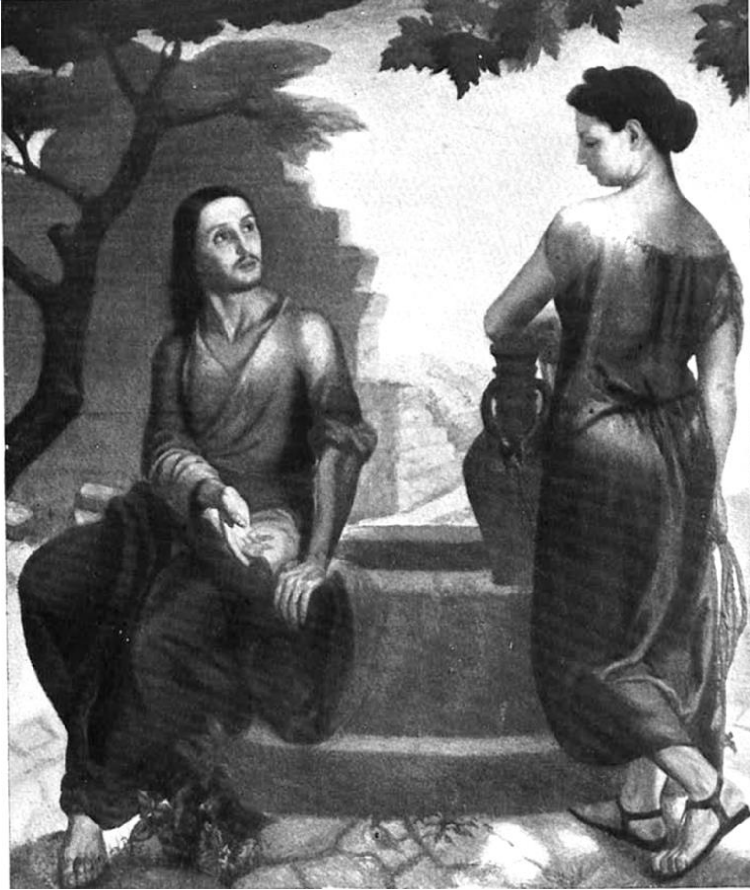
Jesús y la samaritana