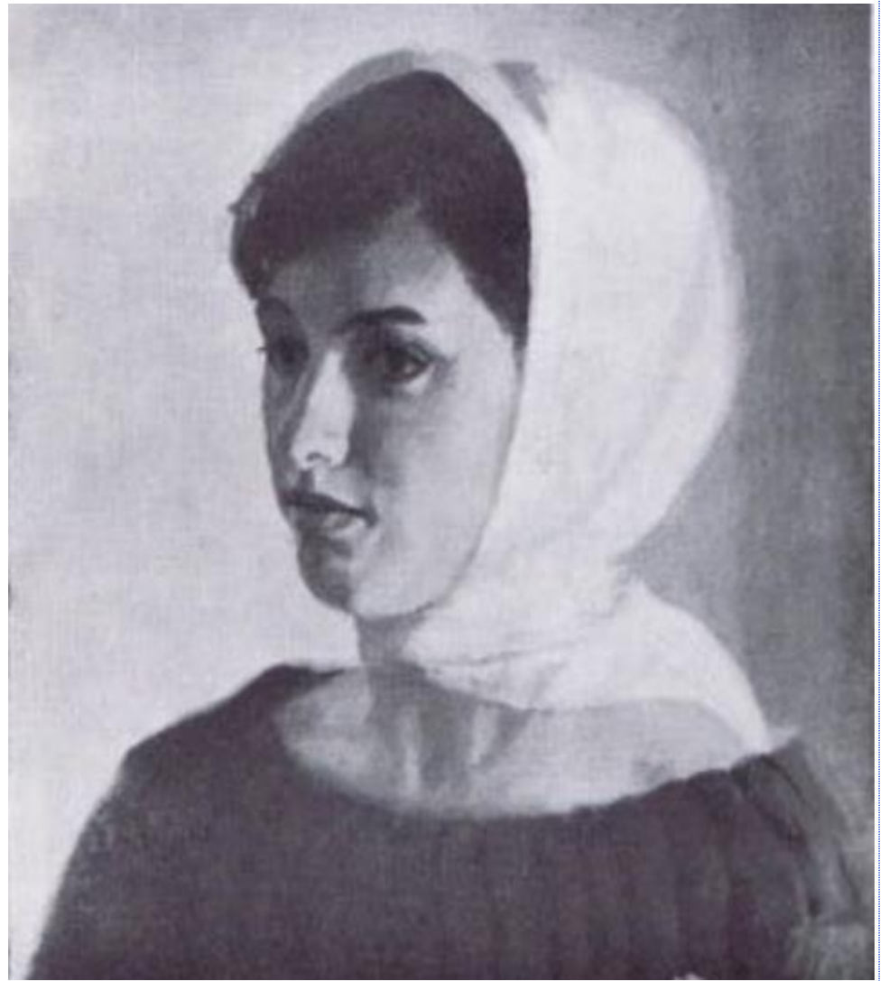
Muchacha, presentado al XXXVII Salón de Otoño